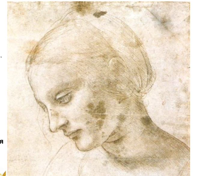
1480 г. Набросок головы Мадонны Литты, сделанный серебряным карандашом на тонированной зеленой бумаге

Поздравляем всех-всех мам, мамочек, мамуль, настоящих и будущих, с Днем матери!!! Пусть Ваши малыши, и маленькие, и большие, дарят Вам только счастье и радость!