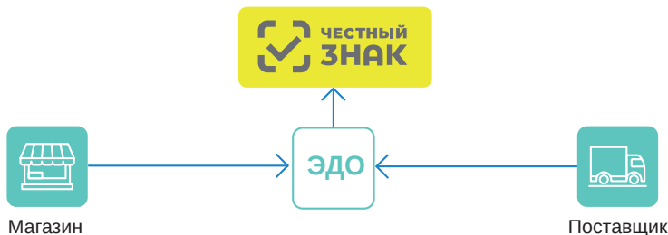
Рис. 2. ЭДО автоматически передаёт данные о смене собственника

Способ 1. Поскольку УПД чаще всего применяется в качестве гибрида (счёт-фактура + первичка), этот способ зафиксирован в НК РФ и в Постановлении Правительства РФ от 26.12.2011 № 1137. Покупатель должен убедиться, что на товар нанесены читаемые коды, которые зарегистрированы в системе «Честный знак», принадлежат поставщику и находятся в обороте. Если хотя бы одно из условий не выполняется, покупатель вправе не принять товар.