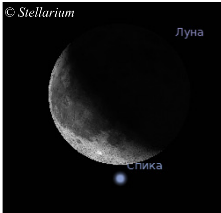
Луна покрывает Спика утром 27 декабря

Хотя красная звезда Марса будет неплохо смотреться при наблюдении невооружённым взглядом или с биноклями, телескопически этот объект всё ещё слишком мал и с любительскими телескопами будет непросто рассмотреть на нём какие-либо детали, кроме северной полярной шапки. Но уже в апреле 2014 года видимый диаметр Марса достигнет 15.2", что позволит рассмотреть на нём значительно больше подробностей.